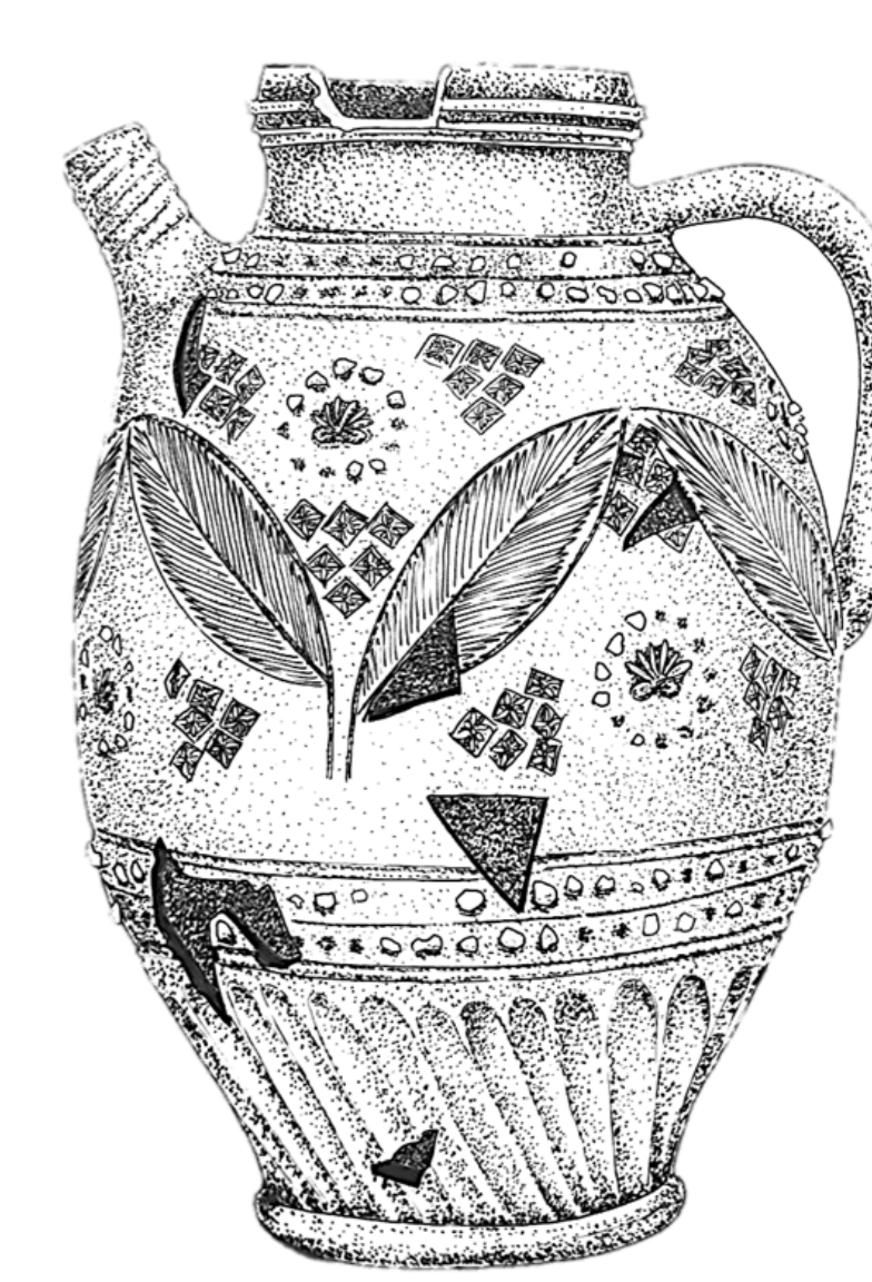
Stav před restaurováním