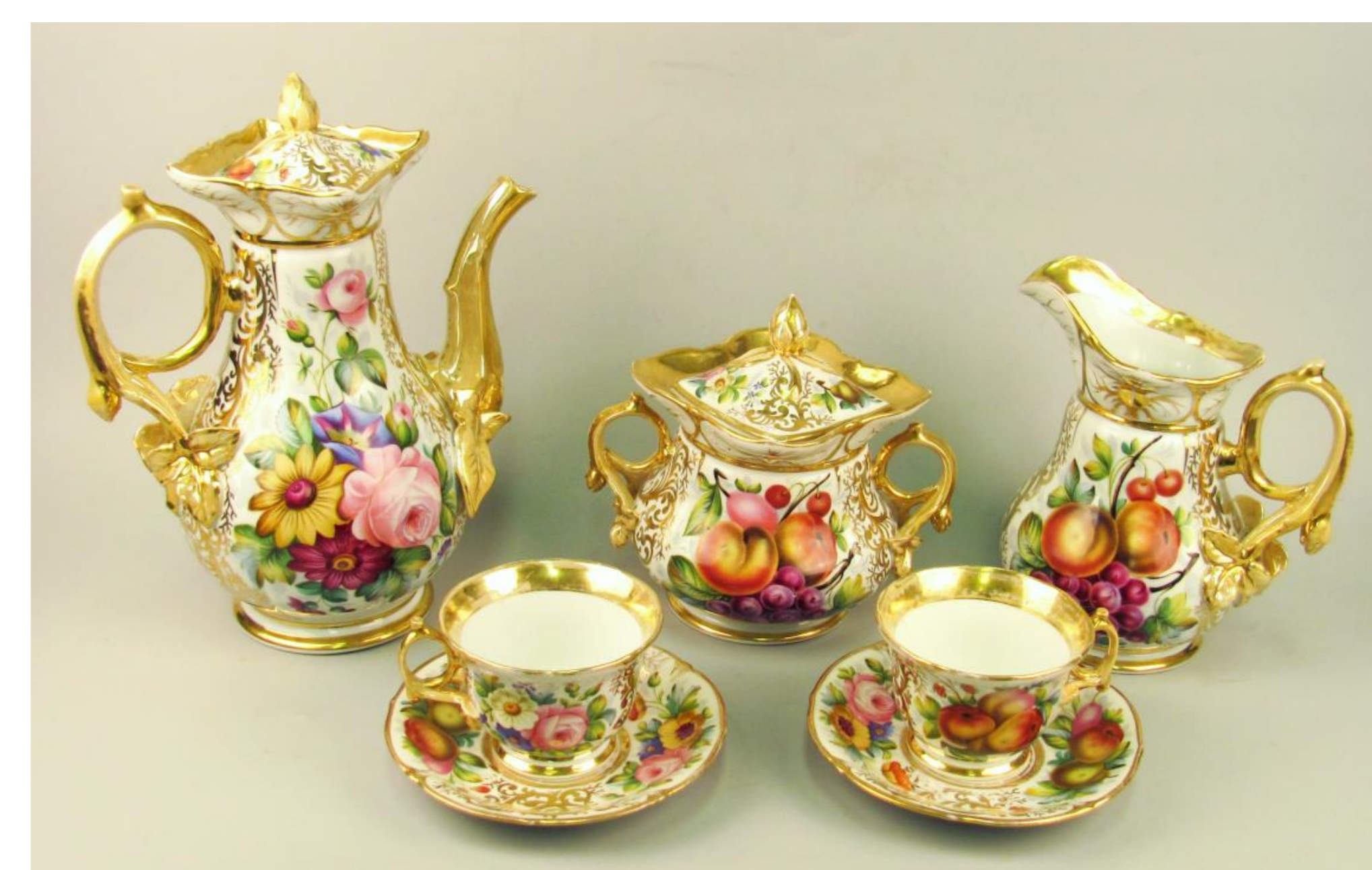
stav před restaurováním