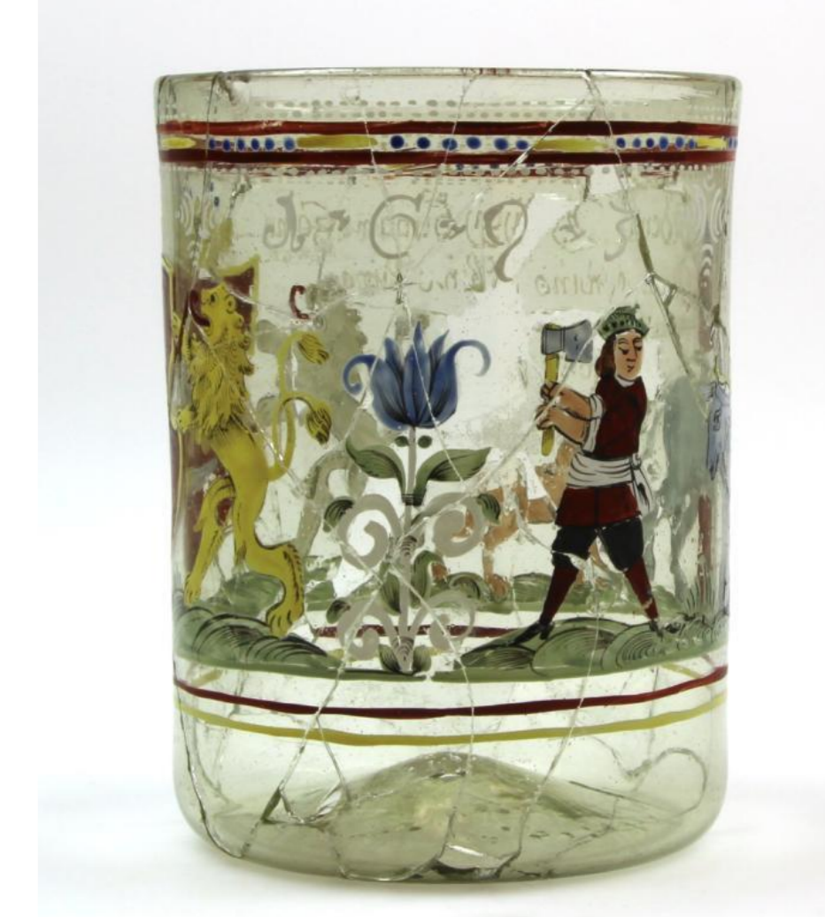
stav před restaurováním