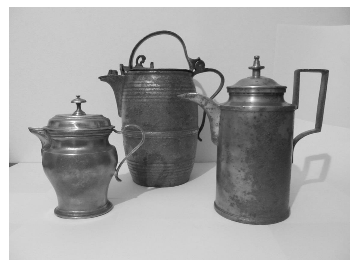
stav po restaurování