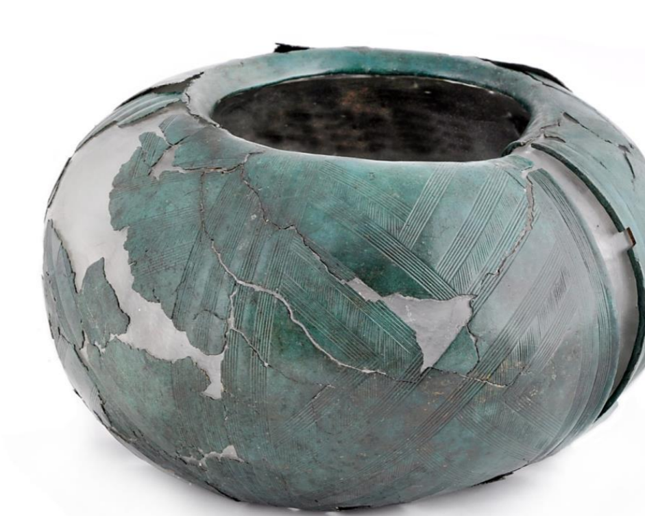
stav po restaurování