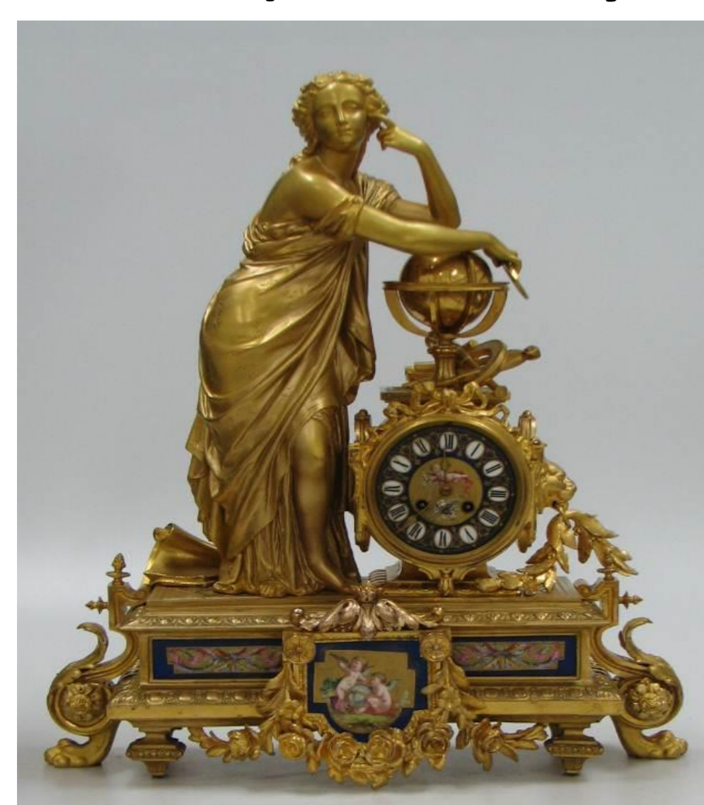
stav po restaurování