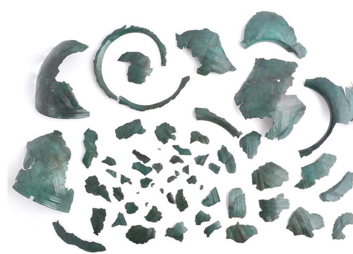
stav před restaurováním