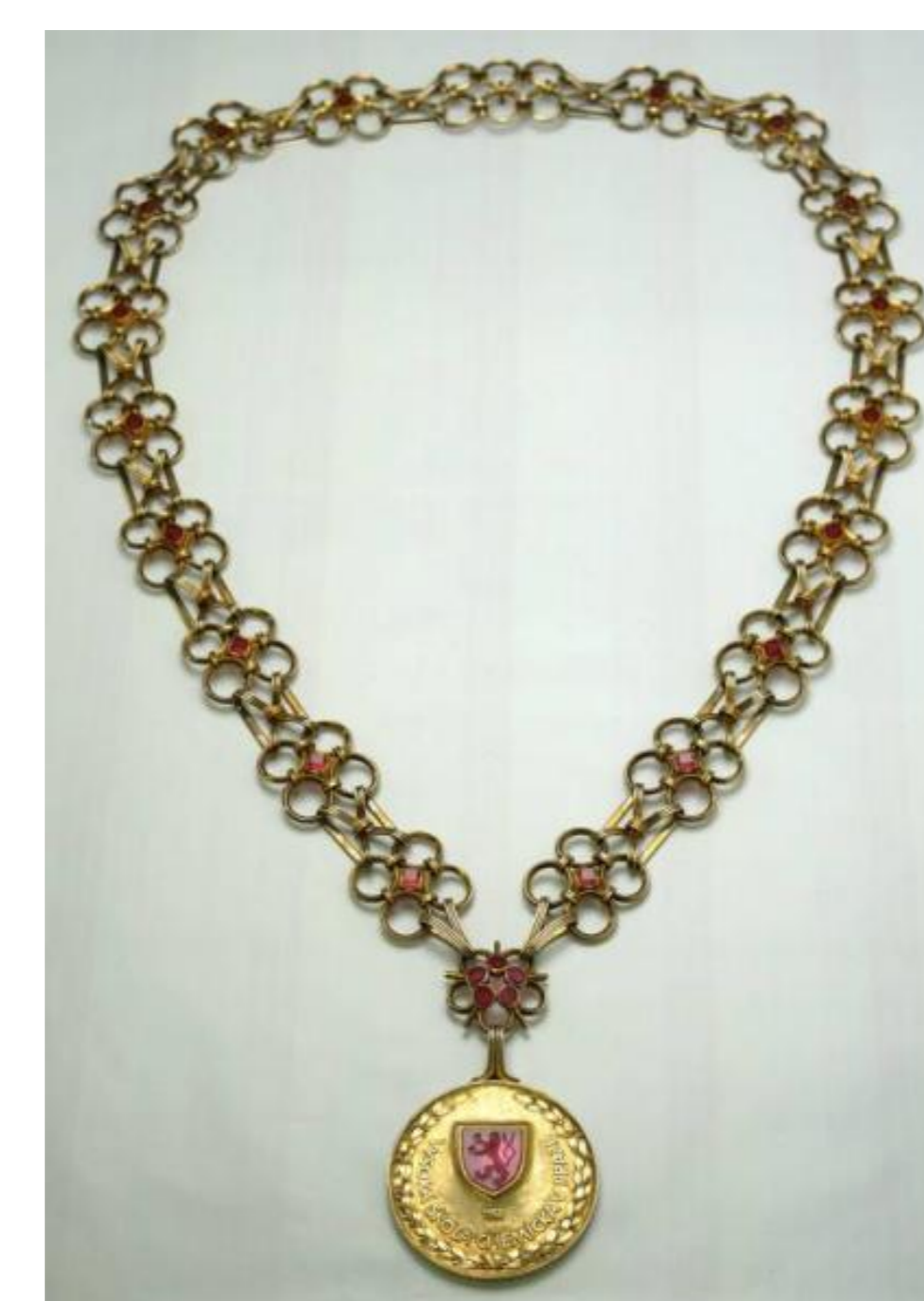
Insignie rektora VŠCHT Praha (pol. 20. stol.)