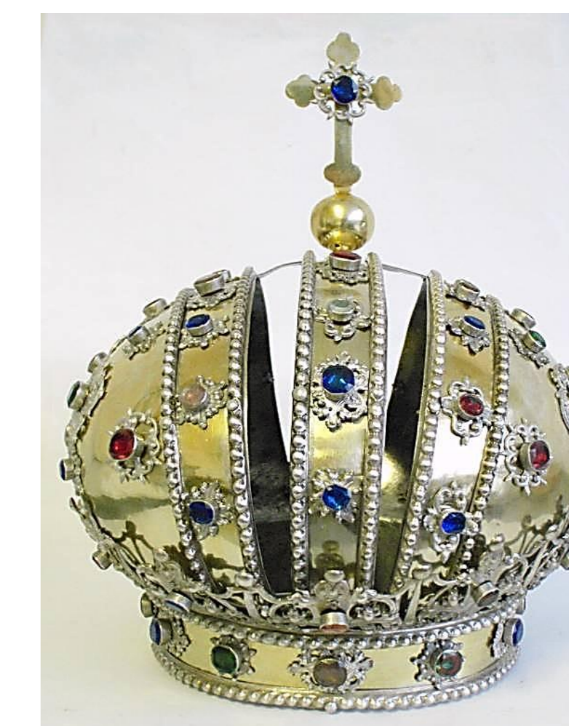
stav po restaurování