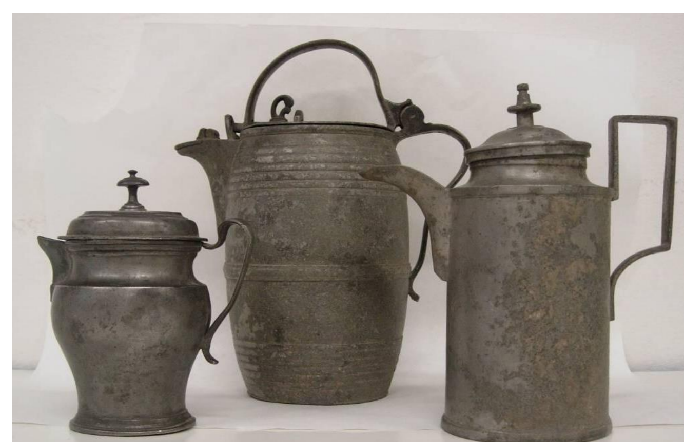
stav před restaurováním