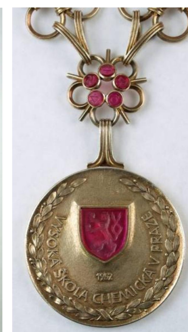
stav po restaurování