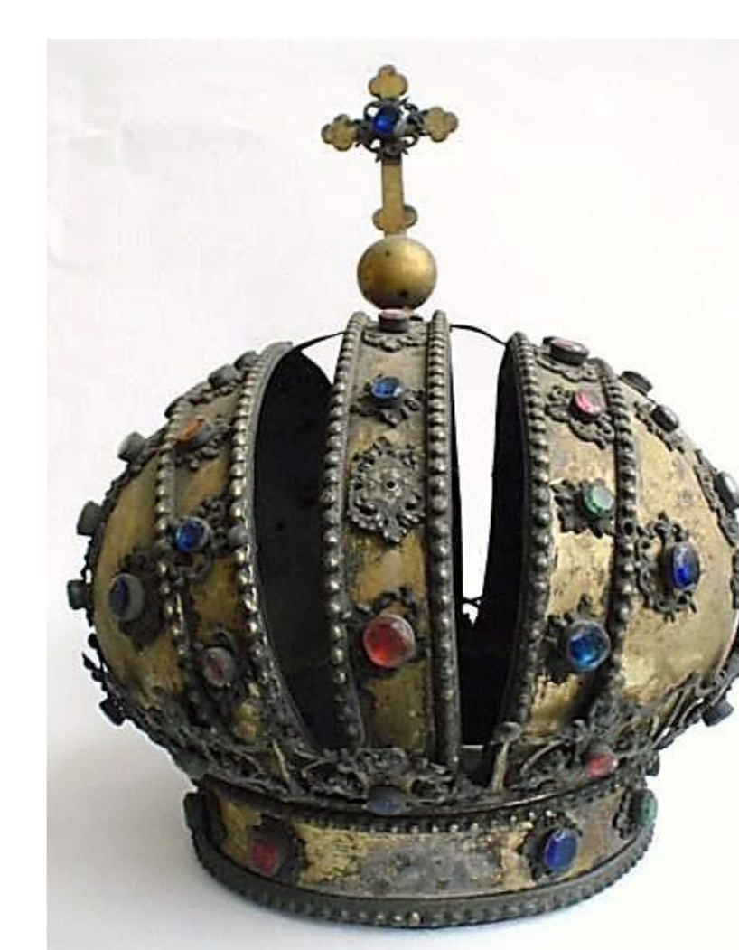
stav před restaurováním