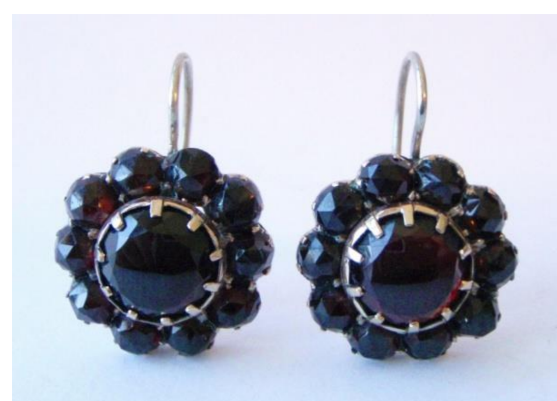
stav po restaurování